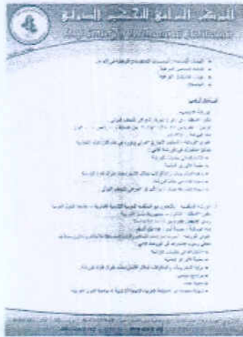
ورشة القاهرة 20152 نسخ ك.ب 917 ~