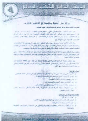
jpg ورشة القاهرة 20151 نسخ ك.ب 1007 ~