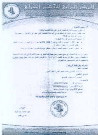
ورشة القاهرة 20153 نسخ ك.ب 917 ~